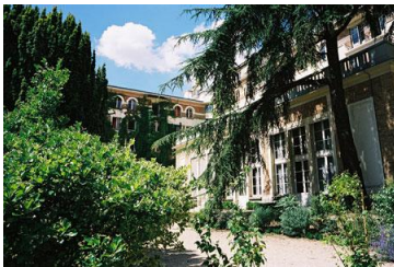
Pavillon des Etats Unis

Nous sommes venus à la Cité U pour une balade en plein air et profiter du beau temps dans ce parc riche de 400 essences différentes (dont le Ginkgo biloba), étendu entre le Boulevard des Maréchaux et le périphérique mais c'est surtout les maisons d'hébergement des étudiants qui captent notre attention.