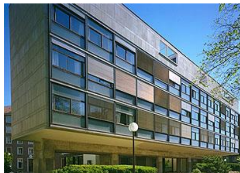
Pavillon Suisse (Le Corbusier)