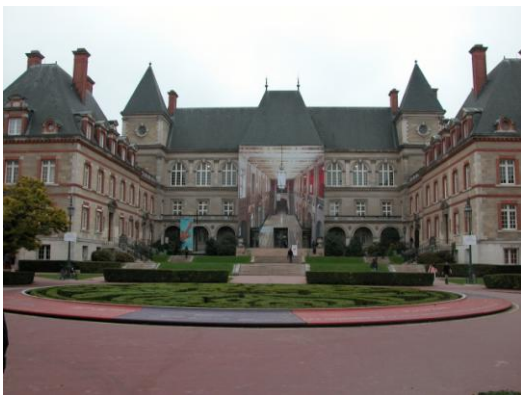
Pavillon des Provinces de France

Ils ont voulu « favoriser les amitiés entre étudiants et élites internationales et ainsi permettre l'entente entre les peuples »*