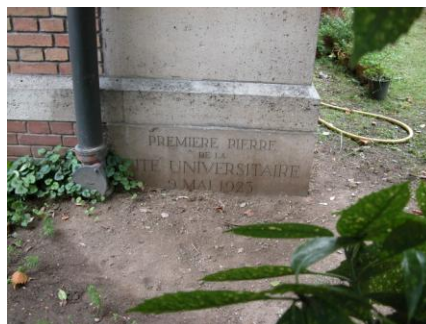
Première pierre 1923