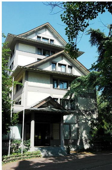
Pavillon du Japon