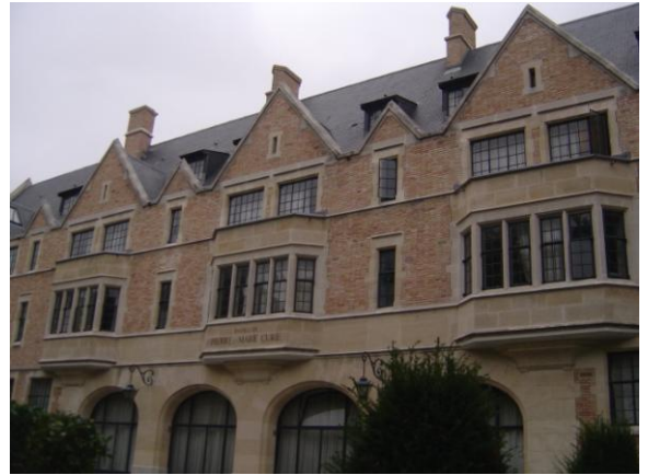
Pavillon Pierre et Marie Curie

« Sur 34 ha, 37 maisons accueillent chaque année 5500 résidents de 130 nationalités »* « Même si la dénomination des maisons fait souvent référence à un pays (Maison de Norvège, de l'Italie), chacune d'elles pratique le brassage de nationalités en réservant au moins 30% de ses chambres à des résidents originaires d'autres pays. »*