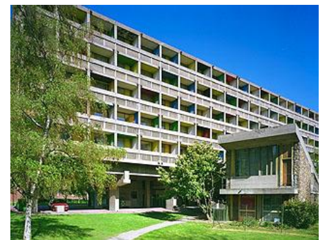
Maison du Brésil (Le Corbusier)

*texte pris dans la brochure guide de visite